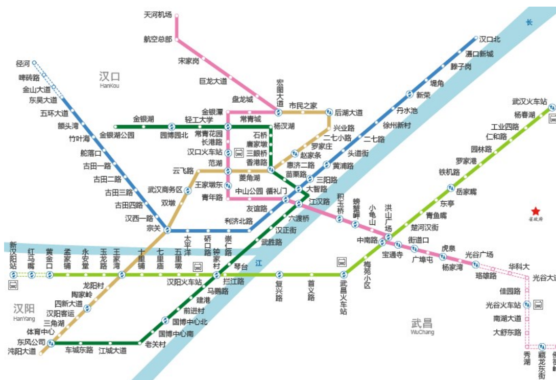
截至 2016 年底武汉地铁运营线路图

2 号线南延线全长 13.35 公里，设车站 10 座，概算总投资 126.77 亿元。截至 2017 年 3 月底已累计完成投资 28.11 亿元，预计于 2018 年 12 月建成通车。