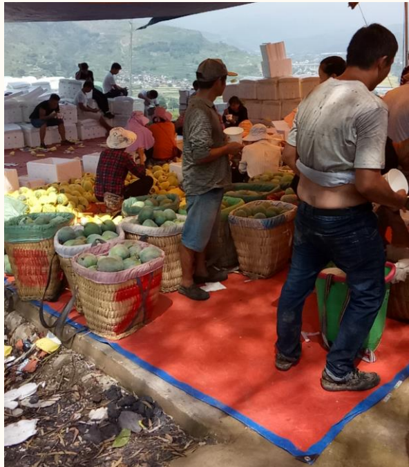
华坪芒果种植户采收现场