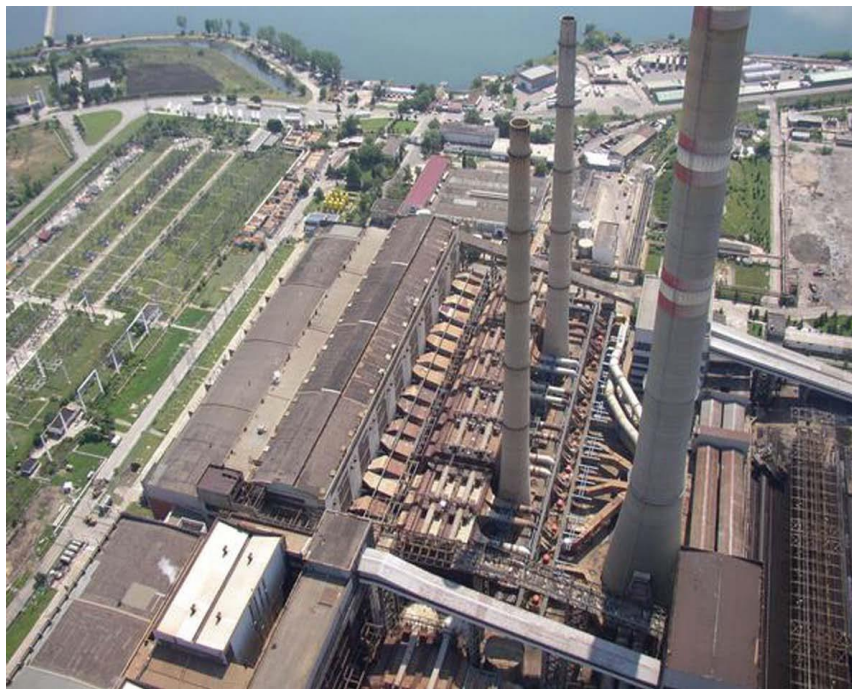
浙大网新承建保最大火电站烟气脱硫项目

【双边经济合作】在保加利亚开展投资、经营的主要中资企业有20余家。中国企业在保加利亚投资经营主要集中在以下四大领域：一是汽车，如销售情况良好的长城汽车项目，宇通中标索菲亚市政110辆公交车项目；二是农业合作，如天津农垦在保农业项目等，天世农项目等；三是通讯领域，如华为、中兴在保加利亚项目；四是可再生能源项目，如伊赫迪曼光伏项目等。