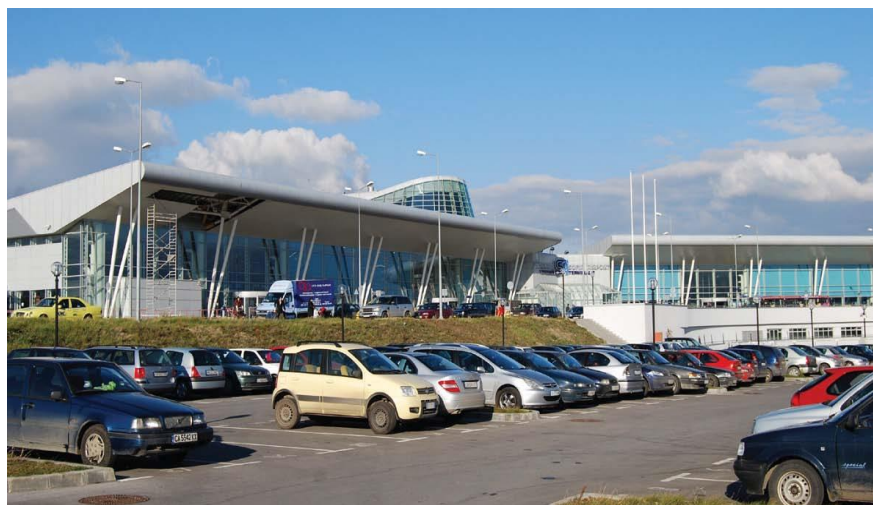
保加利亚首都索非亚市机场

保加利亚共有5个国际机场：索非亚、布尔加斯、瓦尔纳、普罗夫迪夫、格·奥利亚霍维察。客运机场主要是索非亚、瓦尔纳、布尔加斯和普罗夫迪夫机场。保加利亚同欧洲各主要城市、土耳其和以色列有直航班机。中国和保加利亚暂无直航班机，两国往返可经伊斯坦布尔、莫斯科、维也纳或法兰克福等地中转。2017年保加利亚机场共运送旅客1143万人次。