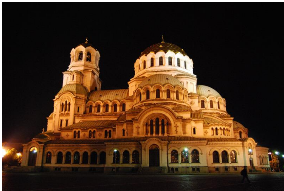
首都标志性建筑——涅夫斯基教堂

首都索非亚，人口约132.5万，是保加利亚政治、经济、文化中心。第二大城市是普罗夫迪夫，第三大城市瓦尔纳。