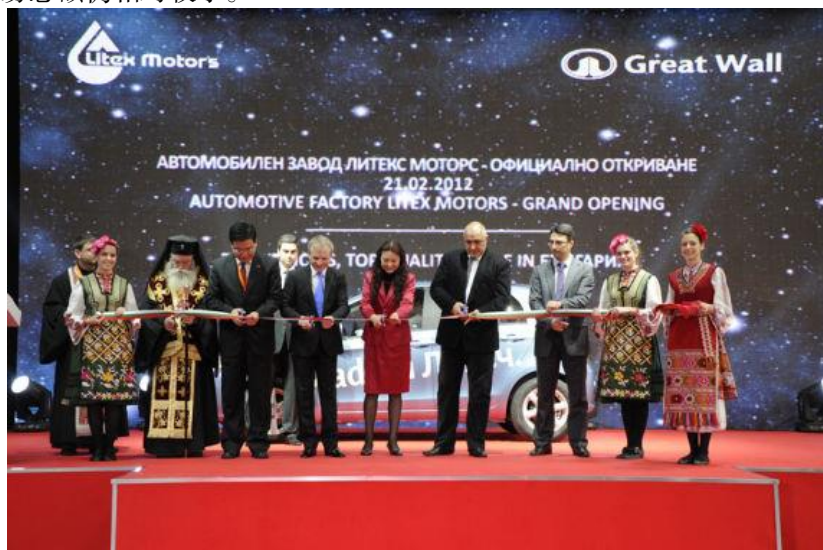
首个在欧洲设厂的我国自主品牌车企——长城汽车

2017年，中保经贸关系总体呈现稳中有升态势，主要表现在：双边往来更加密切，政府和企业间经贸团组互访频繁，保方积极性不断提升；经济合作形式不断丰富，合作领域继续扩大，大部分项目进展顺利；双边贸易总额仍相对较小。