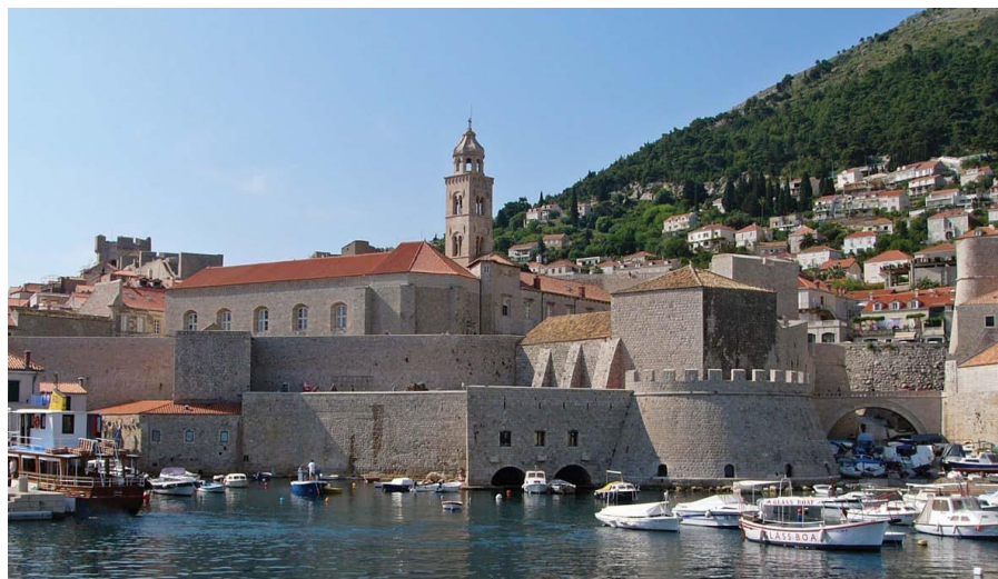
杜布罗夫尼克古城堡

其他主要的经济中心城市有斯普利特、里耶卡、奥西耶克等。其中，斯普利特是克罗地亚第二大城市，达尔马提亚地区第一大海港、造船和航运中心，也是东南欧最著名的旅游胜地之一。