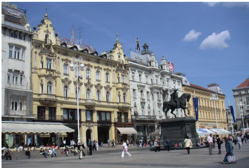
萨格勒布市中心广场