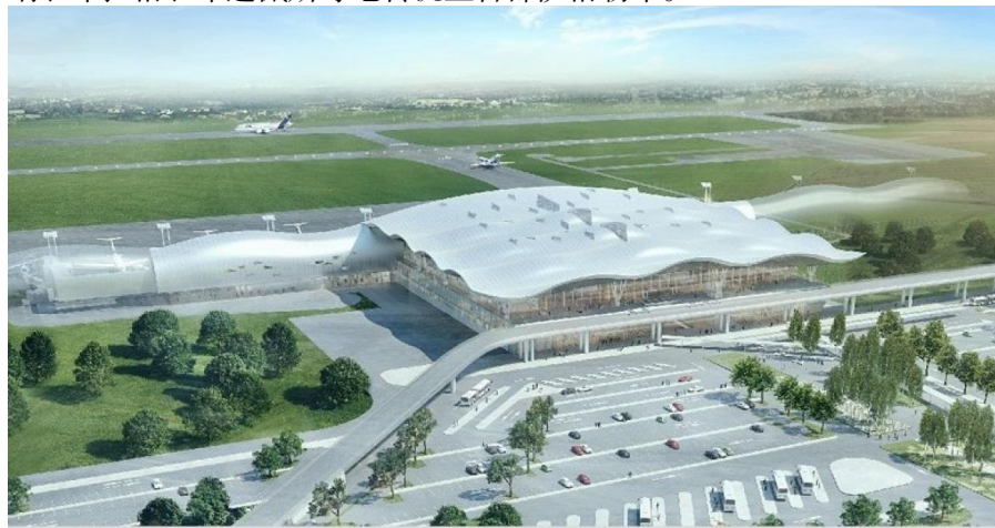
萨格勒布机场新航站楼

目前，中国至克罗地亚无直达航班，但可经莫斯科、法兰克福、维也纳、布拉格、布达佩斯等地转机至首都萨格勒布。