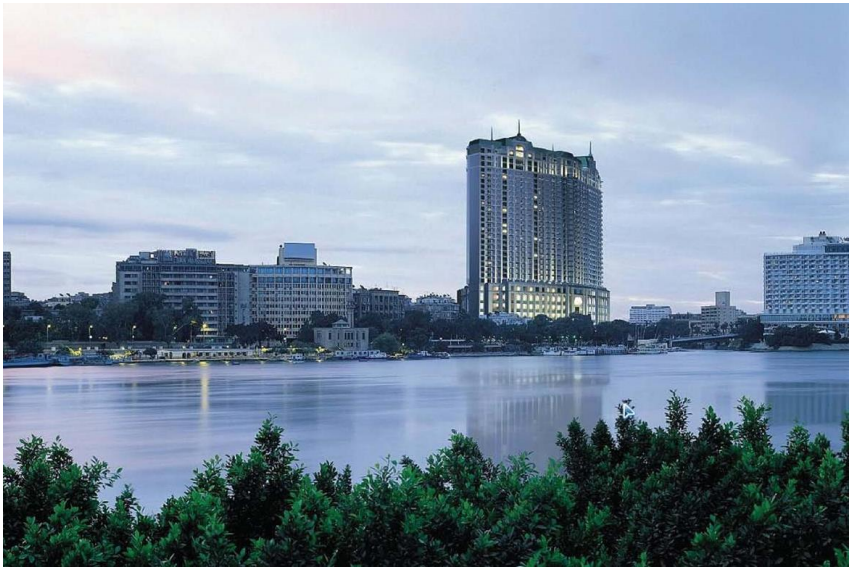
标志性建筑——开罗四季酒店