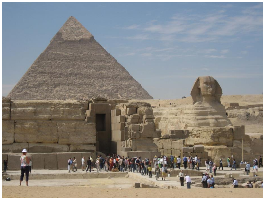
金字塔和狮身人面像

埃及是世界四大文明古国之一。公元前3200年，美尼斯统一埃及建立了第一个奴隶制国家，此后经历了早王国、古王国、中王国、新王国和后王朝时期，共30个王朝。古王国开始大规模建金字塔。中王国经济发展、文艺复兴。新王国生产力显著提高，开始对外扩张，成为军事帝国。后王朝时期，内乱频繁，外患不断，国力日衰。公元前525年，埃及成为波斯帝国的一个行省。在此后的一千多年间，埃及相继被希腊和罗马征服。公元641年，阿拉伯人入侵，埃及逐渐阿拉伯化，成为伊斯兰教一个重要中心。1517年被土耳其人征服，成为奥斯曼帝国的行省。1882年英军占领后成为英国“保护国”。