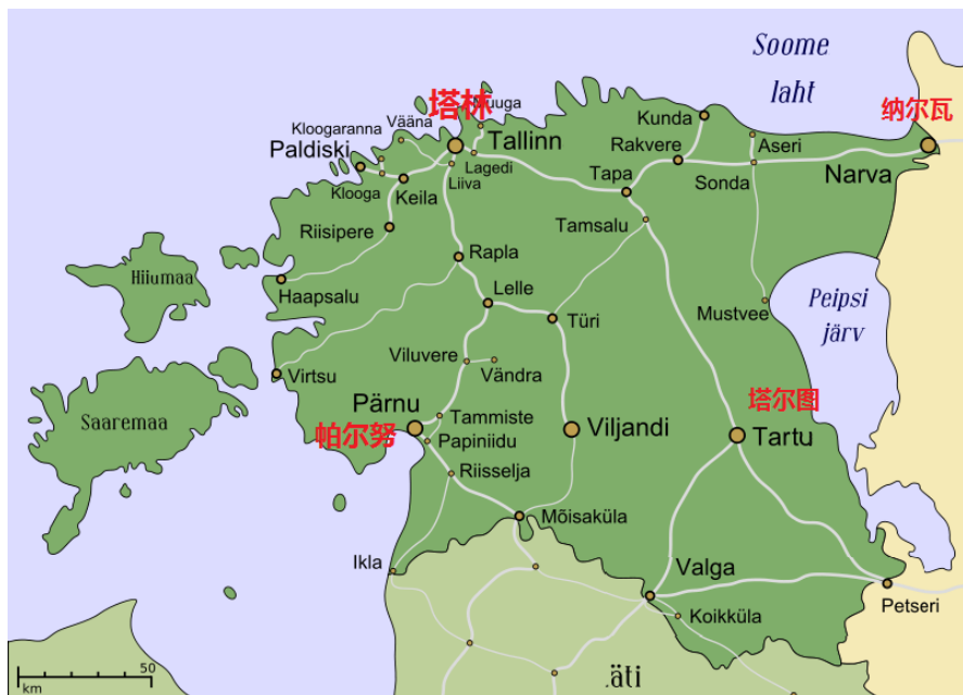
爱沙尼亚公路走向示意图