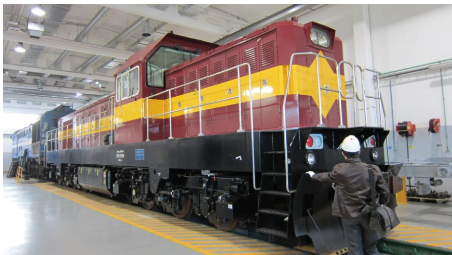
北京二七轨道交通装备厂出口爱沙尼亚的DF7G-E型铁路内燃机车

【投资】据中国商务部统计，截至2017年末，中国对爱沙尼亚直接投资存量362万美元。目前，中国在爱沙尼亚中资企业共有6-7家，多为当地华商经营的私营企业，主要集中在贸易、餐饮、旅游和中医保健等领域。华为公司在爱沙尼亚设有常驻代表处。