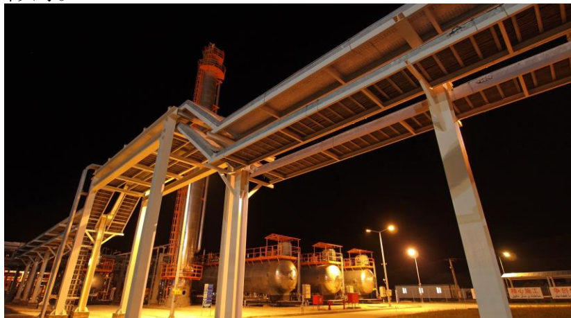
北阿扎德甘油田中心处理站