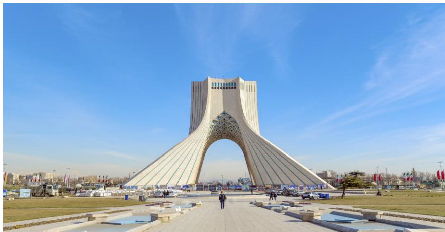
伊朗德黑兰自由塔

【伊朗议会】伊朗最高立法机构，居三权（立法、司法、行政）之首，首届议会成立于1980年5月，实行一院制。议会通过的法律须经宪法监护委员会批准方可生效。议员由各选区选民通过无记名投票直接产生，任期4年，议长与议会发言人通过选举产生，通常为同一人。现有290个议席，其中285个席位由各选区经两轮投票选举产生，剩余5个议席分别专属拜火教选区、犹太人选区、亚述人选区、迦勒底基督教选区和亚美尼亚人选区。现任议长阿里·拉里贾尼于2018年5月30日，赢得出席投票的279个席位中的147个席位的支持，连续11年当选为议会议长（第10届议会议长）。第11届议会换届选举将于2020年举行，议长届中可改选。宪法规定，议会可在宪法规定范围内就所有问题颁布法律，所颁布的法律不得与国教或宪法原则相抵触。议会有权对国家一切事务进行调查和审核，批准同外国签订的条约、协议和重大合同。议会须有2/3议员出席方可成为正式会议，任何提案至少须有15名议员提出才能在议会进行讨论，作出以公民投票方式决定有关国家的重大经济、政治、社会和文化问题决议时，须经出席会议的2/3议员通过。总统经全民选举产生后，须向议会提交内阁人选，议会对此进行信任投票。只要有1/3以上的议员提议即可弹劾总统，如果2/3的多数议员投票通过即可罢免总统并呈领袖批准。内阁部长的去留，由议会对该部长进行信任投票，如出席会议的半数以上议员投信任票，该部长可以留任，否则将被解职。