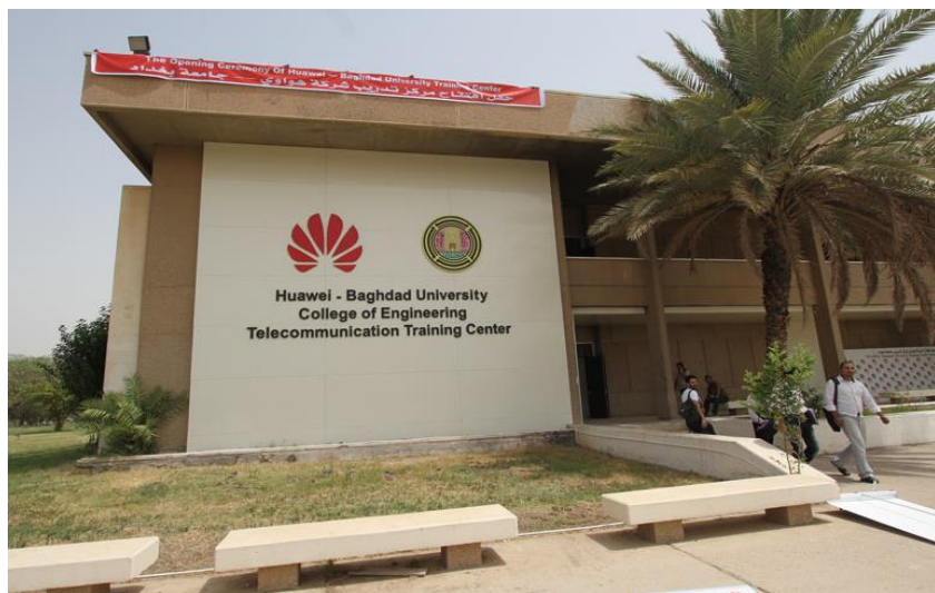
华为-巴格达大学电信培训中心

伊拉克移动用户发展非常迅速，现有的GSM运营商是：ASIACELL、ZAIN、KORAK及部分地方运营商，用户总数约3480万。中国华为技术有限公司和中兴通讯有限公司在伊拉克设有分公司。