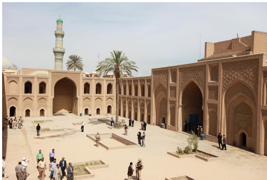
巴格达穆斯坦西里亚大学

【教育】伊拉克实施6年制义务教育，适龄儿童小学入学率为98%，但中等和高等院校入学率仅为45%和15%。成人识字率为74.1%。全国共有20所大学和44所专科院校，包括巴格达、巴士拉、摩苏尔等大学。