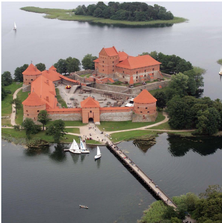
立陶宛著名景点特拉盖