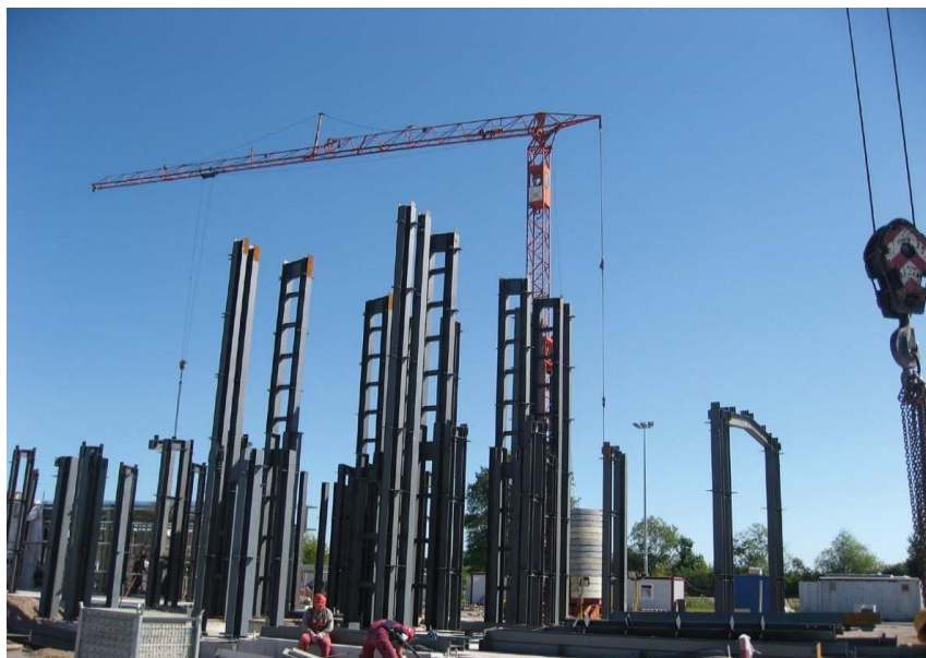
清华同方威视公司中标的500万美元立陶宛集装箱检测设备项目安装现场

【承包劳务】据中国商务部统计，2017年中国企业在立陶宛新签承包工程合同6份，新签合同额720万美元，完成营业额1063.36万美元；累计派出各类劳务人员7人，年末在立陶宛劳务人员5人。