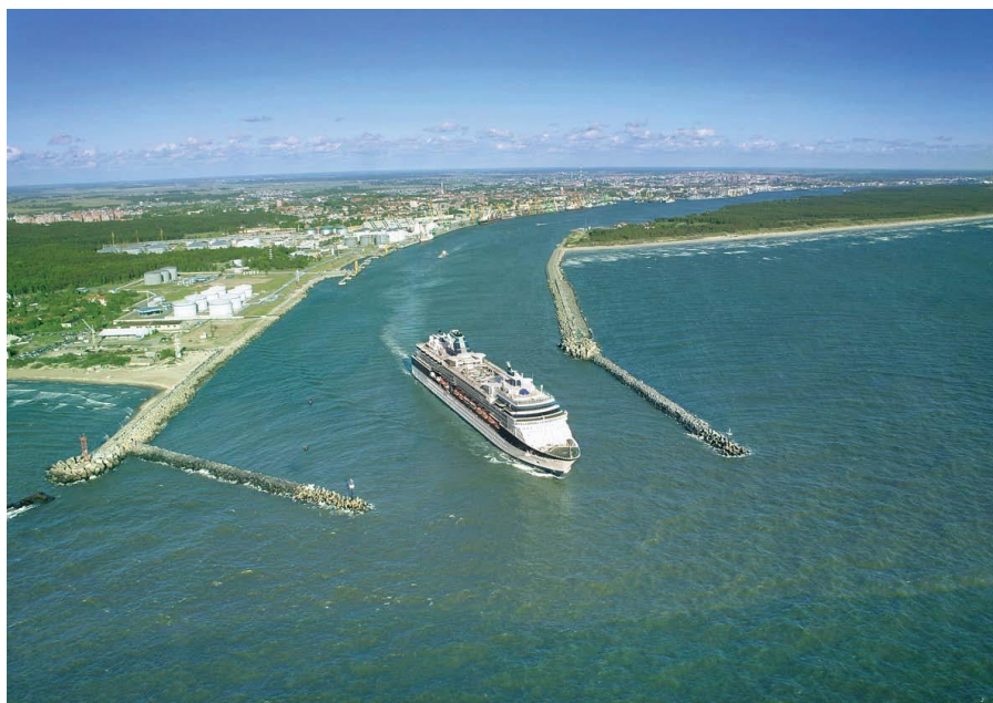
立陶宛克莱佩达港口

进出克莱佩达港的货物可通过铁路和公路运输，目前70%以上货物通过铁路运输，包括石油产品、化肥、金属制品、粮食、原糖等。有两个火车站为港口服务，从港口到白俄边境站433公里、至明斯克595公里、至莫斯科1303公里。目前，从克莱佩达港到乌克兰黑海港口及莫斯科有两趟货运列车：克莱佩达-基辅-奥得萨/伊利契夫斯克港口的VIKING号、克莱佩达/加里宁格勒港口-明斯克-莫斯科的MERKURIJUS号。从克莱佩达港至奥得萨的货运列车使中亚国家与北欧国家之间的货物运输便利化。最近几年，通过公路运输的货物也在增加，包括集装箱、滚装货物、食品等。通过公路从港口至维尔纽斯315公里，至明斯克482公里，至莫斯科1150公里。