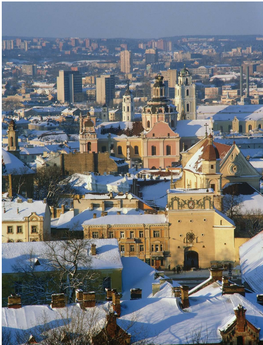
立陶宛首都维尔纽斯老城冬季

【首都】维尔纽斯是立陶宛的首都和最大城市，面积400平方公里，2017年人口80.5万。维尔纽斯的工业产值占立陶宛全国工业总产值的三分