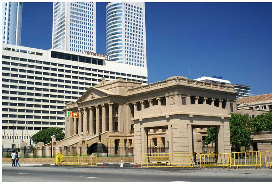
总统秘书处办公楼

【总统】总统为国家元首、政府首脑和武装部队总司令，享有任命总理和内阁成员的权力。现任总统为自由党人迈特里帕拉·西里塞纳，于2015年1月9日宣誓就职，任期5年。