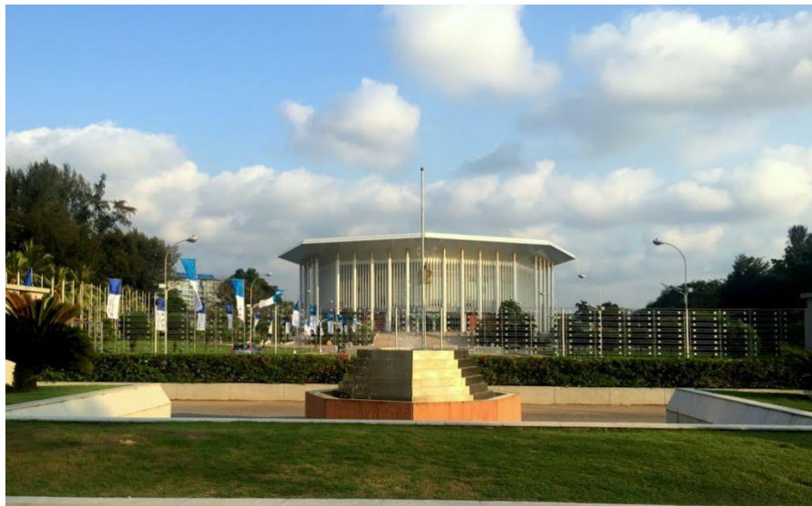
中国政府援建的纪念班达拉奈克国际会议大厦

斯里兰卡终年如夏，无四季之分，只有雨季和旱季。热带季风气候，年均气温 28^{\circ}\text{C} 。5-8月为西南季风雨季，11-2月为东北季风雨季。全国分三个气候带，即干燥地带、潮湿地带和山区地带。沿海地区平均最高气温 31.6^{\circ}\text{C} ，最低气温 24.2^{\circ}\text{C} 。山区平均最高气温 26.6^{\circ}\text{C} ，最低气温 18.2^{\circ}\text{C} 。从全岛来看，每年3-6月气温最高，11-1月气温较低。各地年平均降水量1283-3321毫米不等。