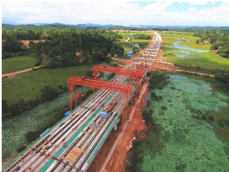
南部高速延长线项目第一标段

【工程质量标准、验收及免责规定】斯里兰卡工程质量标准主要执行英国标准，也可适用国际公认的欧洲标准，个别项目合同规定可使用中国规范，但应符合国际标准要求。一般工程项目无免责条款（除不可抗力因素外）。验收按单位工程、分部工程、分项工程、单元工程、检验批次等方式进行验收。重要隐蔽工程、检验实验、测量、特殊工序等监理工程师全程旁站监测。