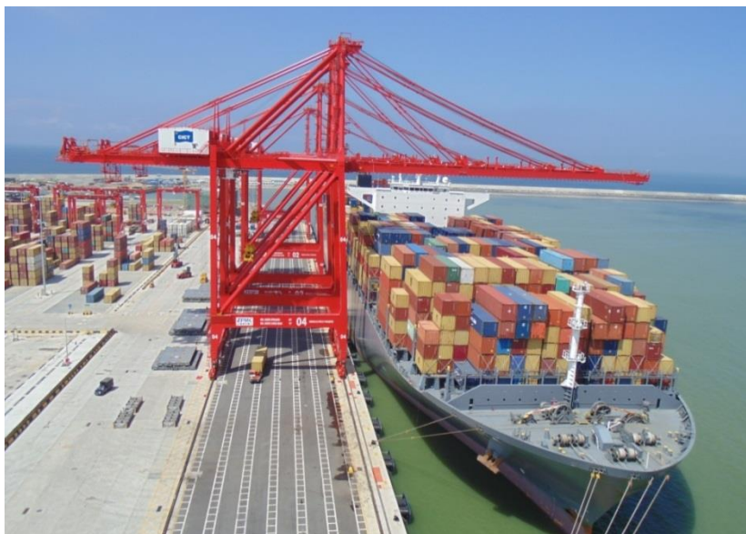
科伦坡港南集装箱码头

斯里兰卡正在进行科伦坡港扩建工程，包括南、东、西三个深水集装箱码头。建成后，科伦坡港将增加 720 万标箱的吞吐量。2014年4月，招商局集团投资的科伦坡港南集装箱码头项目顺利竣工。2017年科伦坡南集装箱码头共停靠船舶 1377 艘，吞吐量超过 238 万标箱，占科伦坡港的 31.8% 。