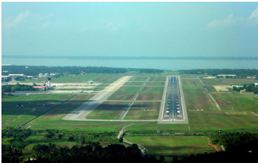
班达拉奈克国际机场

目前，中国国际航空公司执行成都至科伦坡直达航班，中国东方航空公司执行上海、昆明至科伦坡直达航班，中国南方航空公司执行广州至科伦坡航班，旅客可以搭乘中国民航班机，通过成都、上海、昆明、广州等口岸转机到达科伦坡；同时，斯里兰卡航空公司执行北京、上海、广州和昆明至科伦坡直达航班；旅客也可通过香港、曼谷、新加坡、马来西亚吉隆坡等地转机来科伦坡。