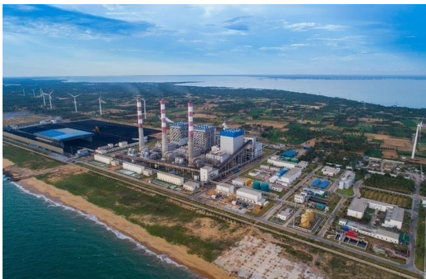
普特拉姆燃煤电站

由中国提供贷款建设的普特拉姆燃煤电站是斯里兰卡目前唯一一个燃煤电站项目。该电站一期一台300MW机组已于2011年2月建成发电，二期两台300MW机组于2014年11月建成发电。普特拉姆燃煤电站装机容量占斯全国装机容量约23%。年发电量占全国用电量约37%，最高单日发电量占全国用电量67.8%。截止2018年4月底，三台机组总发电量259.42亿KW.h，净输出236.07亿KW.h，三台机组平均发电可利用率超过90%。