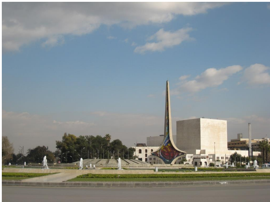
伍麦叶广场-叙利亚首都标志性建筑