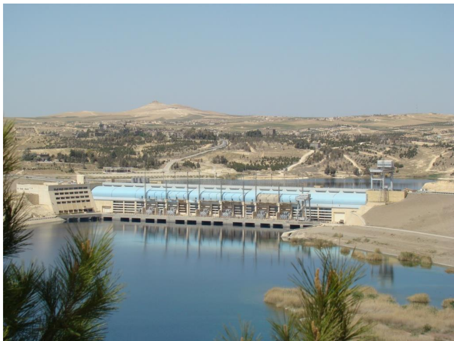
迪什林水电站发电机组

叙利亚2012年电力总发电量约为29480吉瓦时，总用电量约为25700吉瓦时，总装机容量为8958兆瓦，进口电量1234吉瓦时，未出口电量。世界银行数据显示，2014年叙利亚人均电力消费950千瓦时。