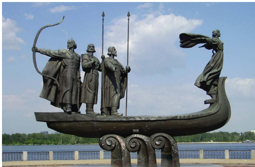
基辅创始人四兄妹雕像

乌克兰全国大部地区为温带大陆性气候。1月平均气温-7.4℃，7月平均气温19.6℃。克里米亚为地中海型亚热带气候。