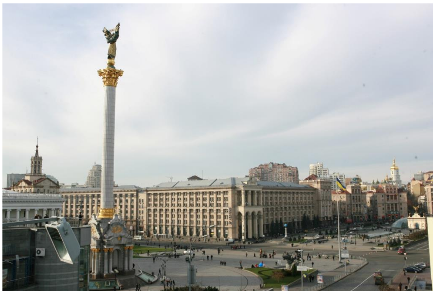
乌克兰基辅独立广场

1917年，东乌克兰地区建立苏维埃政权，成立乌克兰苏维埃社会主义共和国。1922年，苏联成立，乌克兰加入联盟（西部乌克兰于1939年加入）。