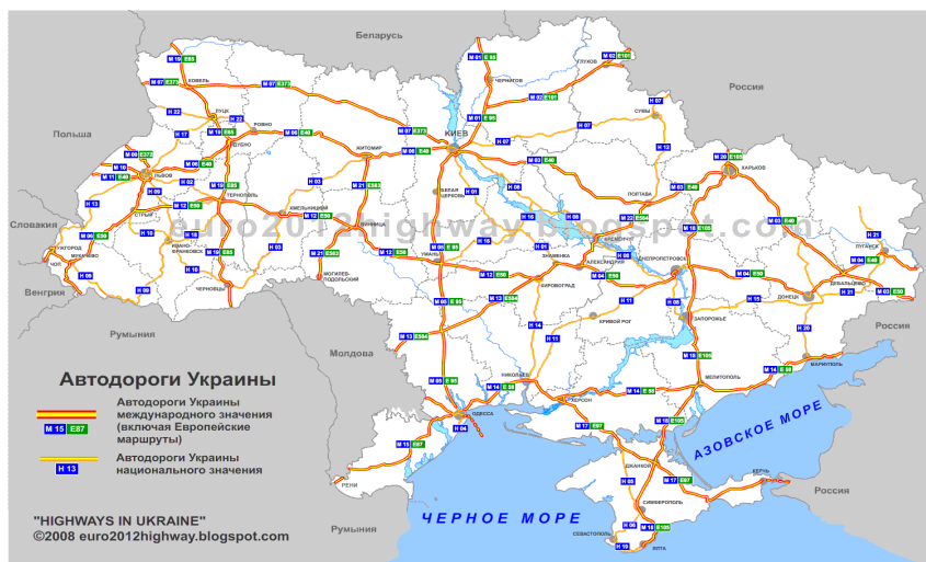
乌克兰国际公路图

乌克兰政府加大了对公路建设的投入力度，设立了2018-2022年公路发展目标，计划拨款3000亿格里夫纳修建公路。2017年乌克兰公路实现货运量1.76亿吨，同比增加12.7%，货运周转量411.79亿吨公里，同比长9.36%。客运量20.18亿人次，同比下降0.3%，客运周转量354.12亿人公里，同比增长2.5%。