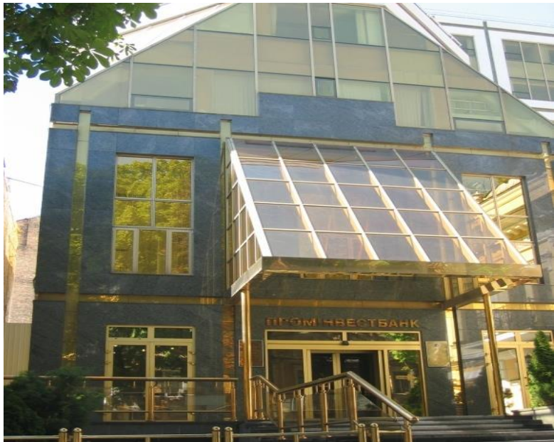
中资公司承建的乌克兰工业投资银行大楼

【双边投资】据中国商务部统计，2017年当年中国对乌克兰直接投资流量475万美元。截至2017年末，中国对乌克兰直接投资存量6265万美元。乌克兰对中国投资存量10831万美元。