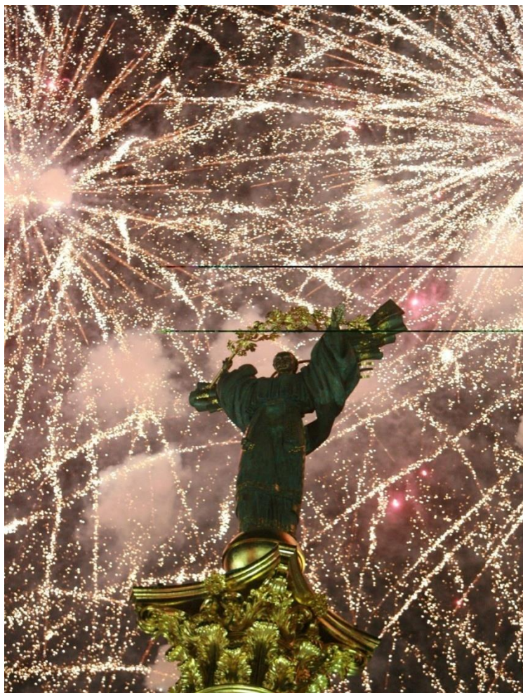
乌克兰基辅独立纪念碑

1990年7月16日，乌克兰议会通过《乌克兰国家主权宣言》。1991年8月24日，乌克兰宣布独立。1991年12月25日，苏联解体，乌克兰成为独立国家。1996年，乌克兰通过新宪法，确定乌为主权、独立、民主的法制国家，实行共和制。