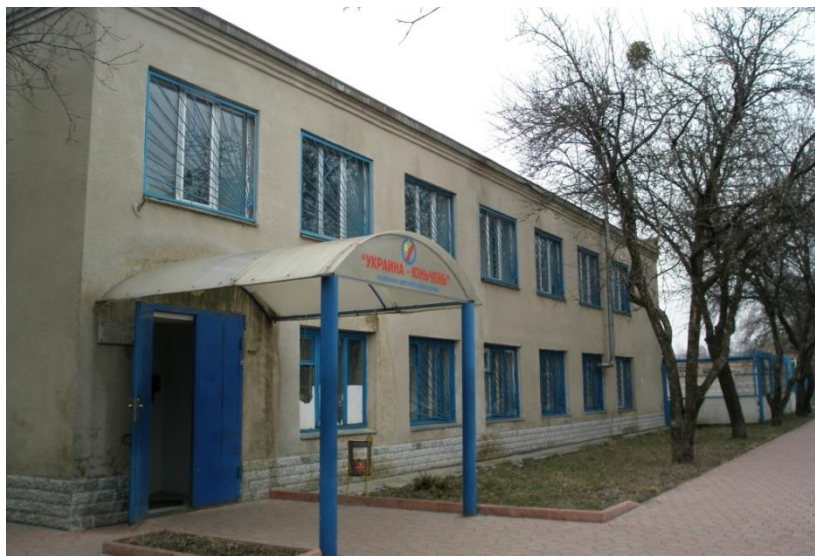
乌克兰运城彩印公司全景

【中乌双边经贸协定】中国与乌克兰建交以来，两国在经贸领域签署了一系列重要的政府和部门间合作协定，主要包括《中乌政府间经贸合作协定》、《中乌政府间投资保护协定》、《中乌政府间关于避免双重征税和防止偷漏税的协定》、《中国人民银行和乌克兰国家银行间合作协议》、《中乌政府间海关合作协定》、《中华人民共和国国家统计局和乌克兰统计部合作协议》、《中华人民共和国和乌克兰进出口商品合作评定合作协议》、《中华人民共和国政府与乌克兰政府关于标准计量合格评定合作协定》、《中华人民共和国和乌克兰知识产权保护协定》等，上述协定为中乌双方企业开展经济贸易合作奠定了牢固的法律基础。