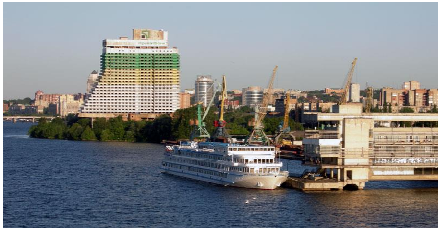
乌克兰河港城市第聂伯