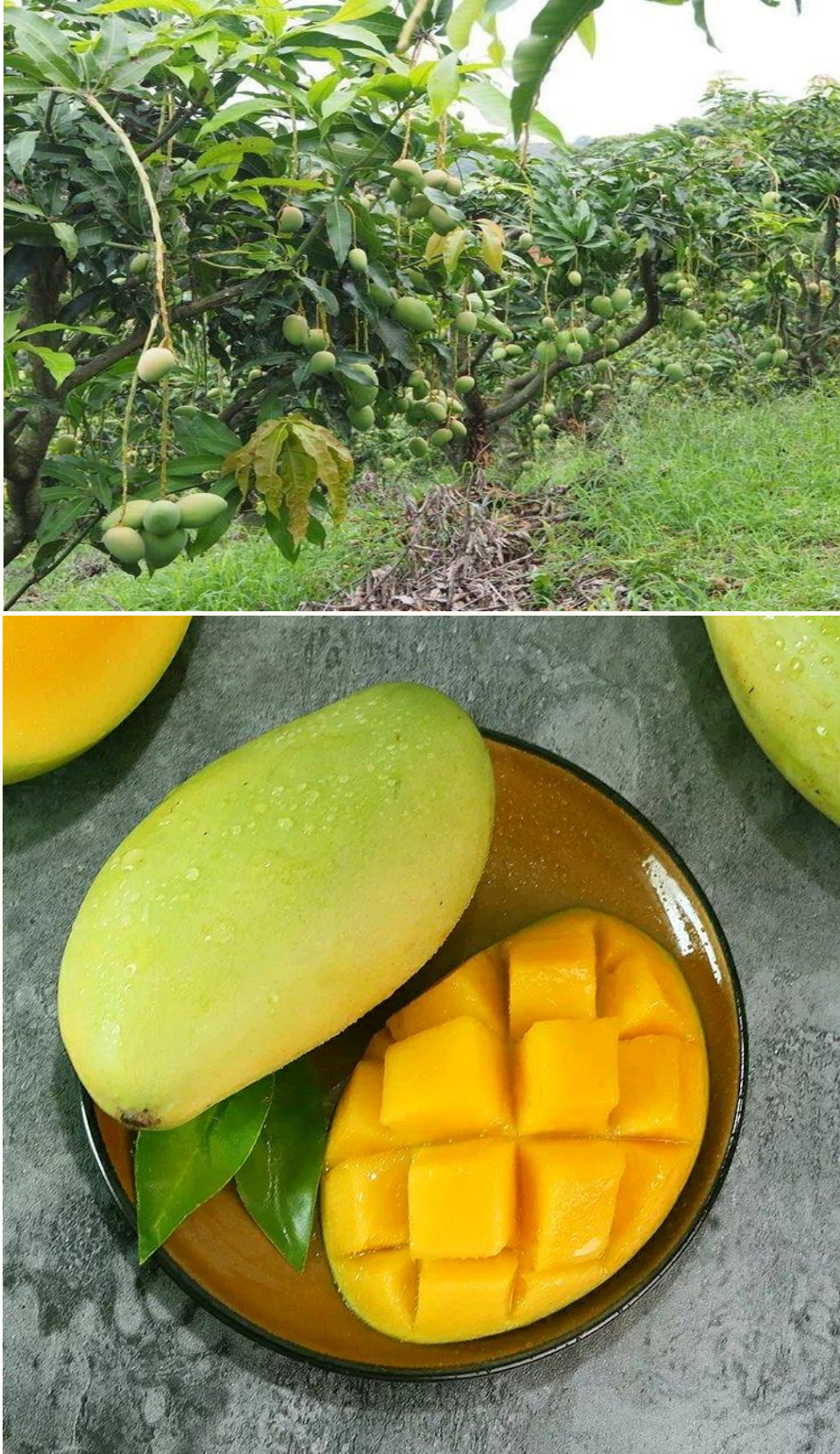
玉芒种植园及果实图