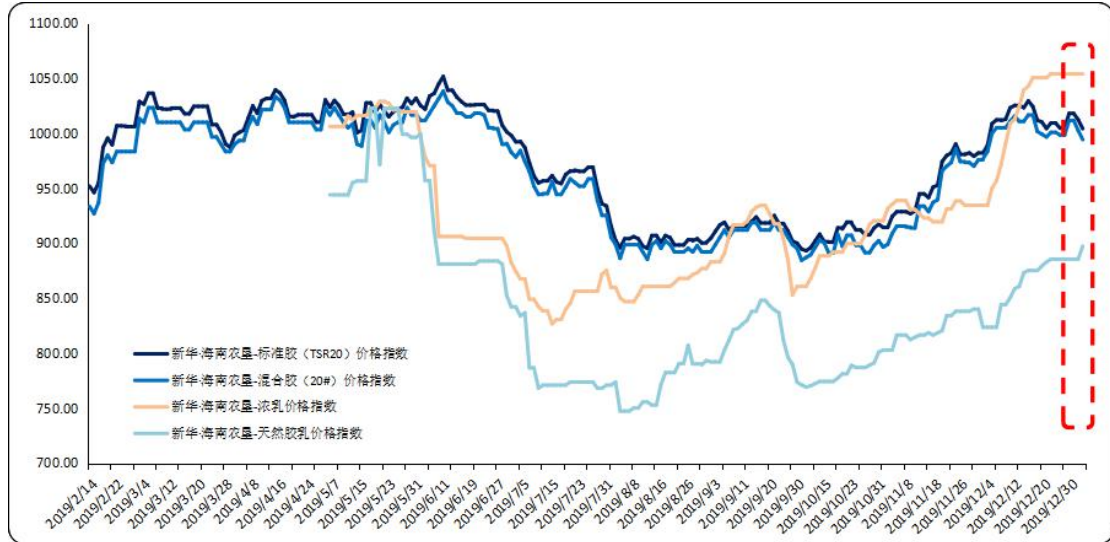
图1 新华·海南农垦-天然橡胶系列价格指数运行图