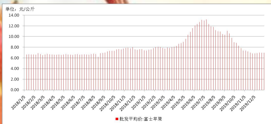
图 1 富士苹果批发平均价

据农业农村部数据，1月3日当周，全国富士苹果批发平均价为6.97元/公斤，较上周上涨0.01元，涨幅0.14%。