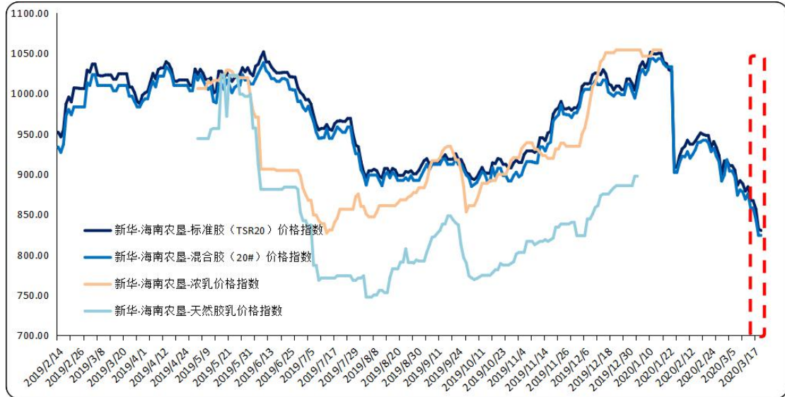
图1 新华·海南农垦-天然橡胶系列价格指数运行图