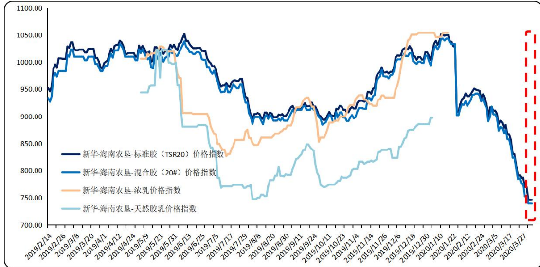
图1 新华·海南农垦-天然橡胶系列价格指数运行图