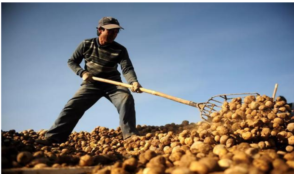
表 1：马铃薯产业开启定西脱贫致富路

据了解，“蓝天扶贫”马铃薯供应链融资模式先后带动了定西福景堂农产品农民专业合作社、定西国宝农产品农民专业合作社等130余家农民专业合作社和30余家马铃薯种植、收购大户的发展，直接或间接带动马铃薯种植户2万余户，贫困户5000余户。供应链融资模式用对整个马铃薯供应链信用的评估代替对单一小微企业、农户的信用评估，在对供应链的物流、资金流和信息流的充分掌握基础上，有效地解决了小微企业和农户信用评价机制不完善等问题，金融“活水”浇灌定西人的“金色产业链”，助力乡村振兴。