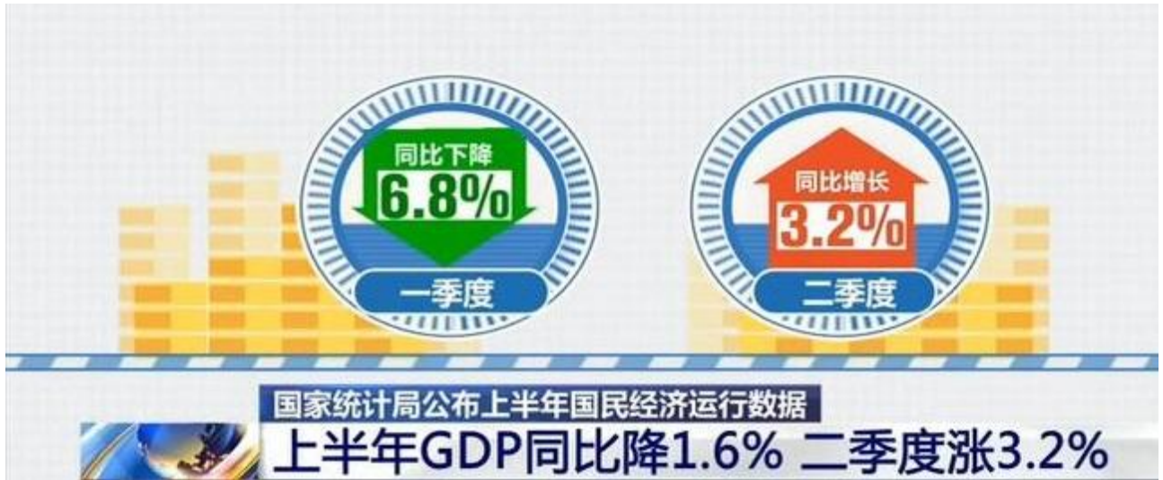
图表 2：经济增速由负转正

个百分点。从月度看，规模以上工业增加值连续三个月保持正增长，服务业生产指数连续两个月正增长，社会消费品零售总额连续四个月降幅收窄，出口额连续三个月正增长。