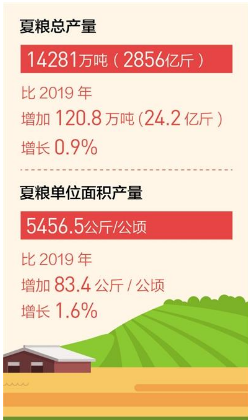
图表 1：2020 年夏粮总体情况