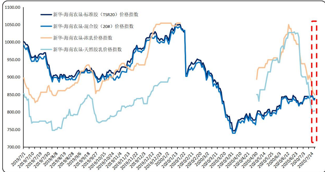
图1 新华·海南农垦-天然橡胶系列价格指数运行图