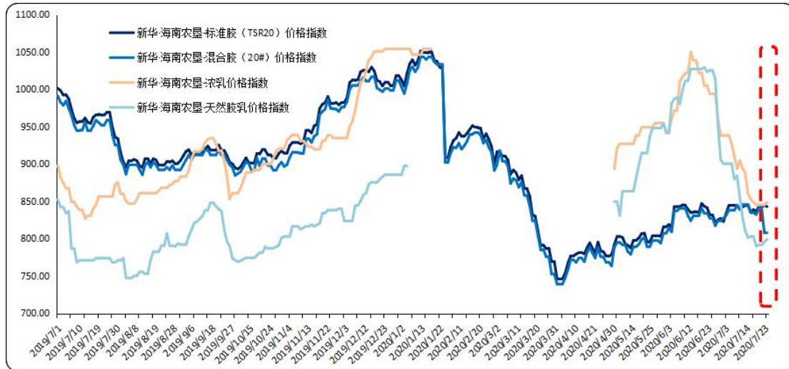
图1 新华·海南农垦-天然橡胶系列价格指数运行图