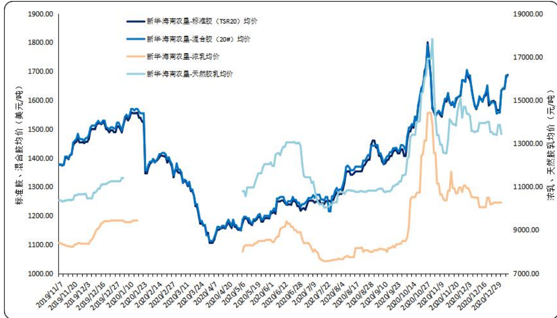
图2 新华·海南农垦-天然橡胶各品种均价走势图