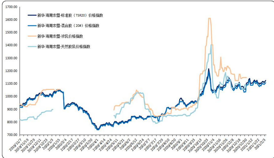
图1 新华·海南农垦-天然橡胶系列价格指数运行图