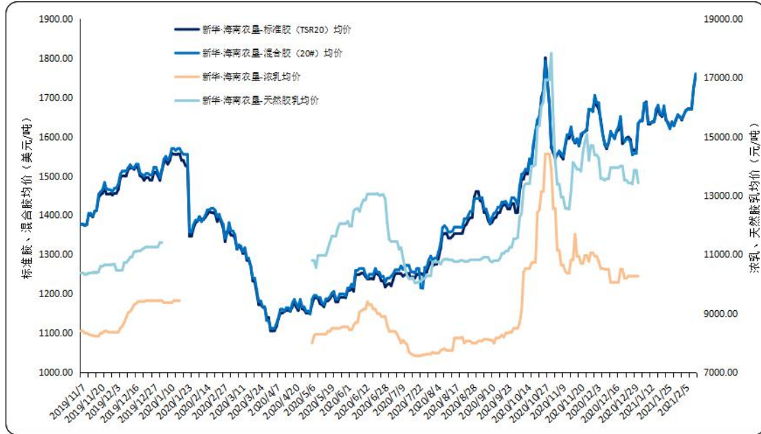
图2 新华·海南农垦-天然橡胶各品种均价走势图