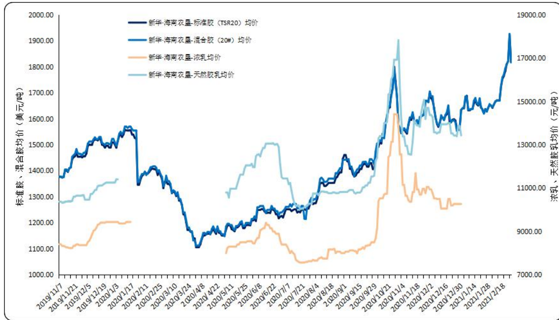
图2 新华·海南农垦-天然橡胶各品种均价走势图