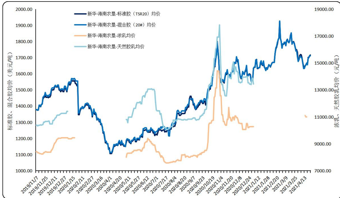
图2 新华·海南农垦-天然橡胶各品种均价走势图