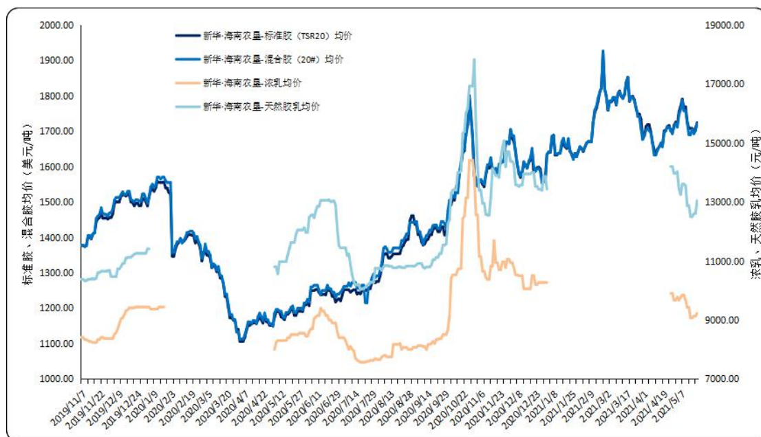
图2 新华·海南农垦-天然橡胶各品种均价走势图