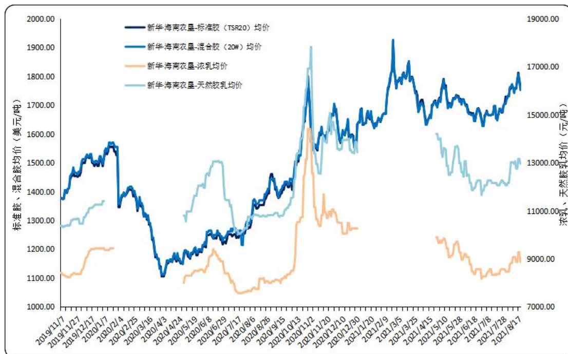
图2 新华·海南农垦-天然橡胶各品种均价走势图