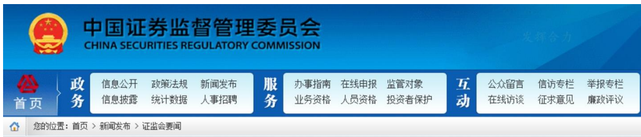
图表 3：证监会建设北京证券交易所的主要思路

证监会上述表态，意味着精选层挂牌公司可省去转板过程，直接到北京证券交易所上市。而截至2021年9月2日，新三板共有7304家挂牌公司，挂牌公司总市值近2万亿元，其中精选层、创新层的挂牌公司分别为66、1250家，奠定了北交所上市标的短期扩容空间。