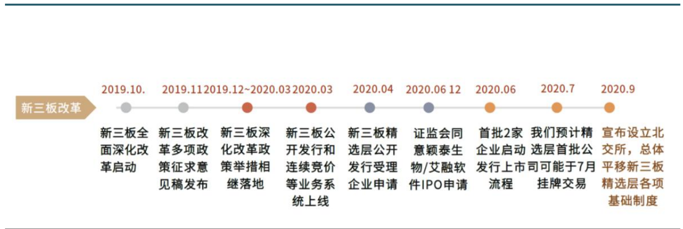
图表 1：新三板重要改革举措时间表

自2013年正式运营以来，新三板在多次资本市场改革探索中成长为资本市场服务中小企业的重要平台，并为激发市场活力做出重要贡献。设立北京证券交易所已具备了坚实的市场基础、企业基础和制度基础。