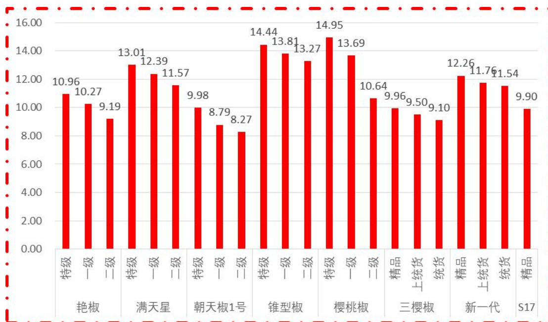
图 1 各品种、各等级周度均价