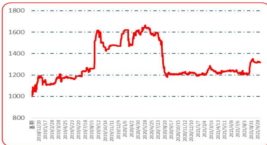
图 3 艳椒批发价格指数运行图