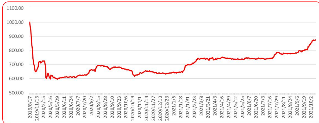
图 8 三樱椒（干椒）批发价格指数运行图