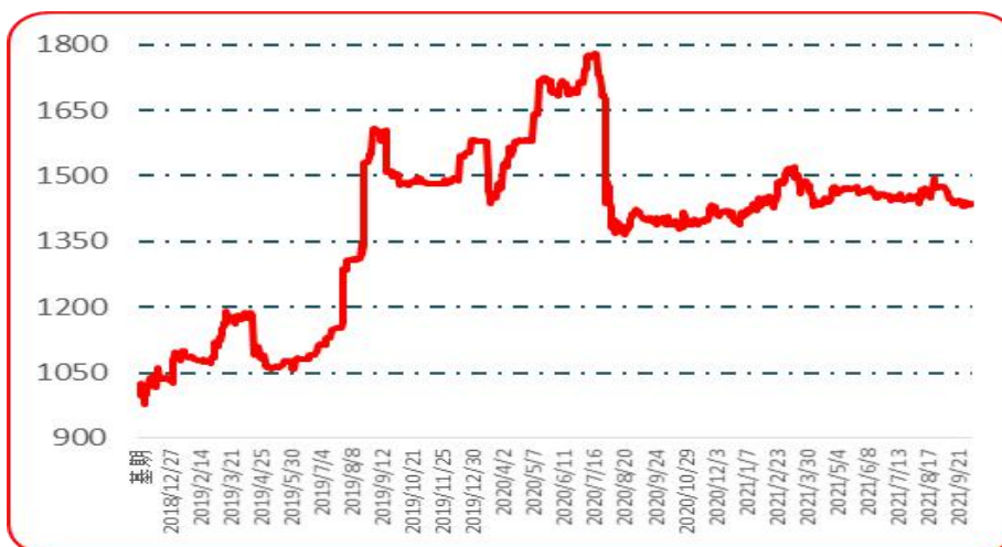
图 4 满天星批发价格指数运行图