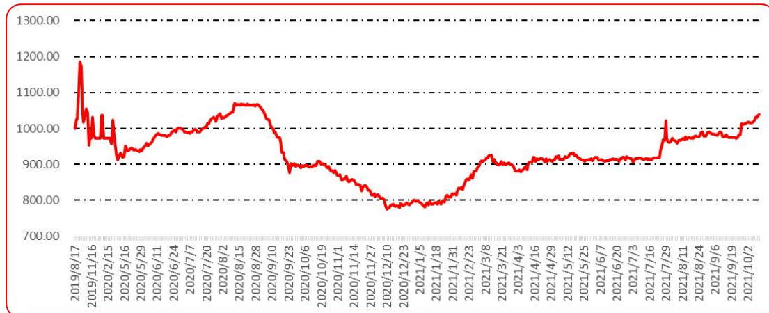
图 9 新一代（干椒）批发价格指数运行图