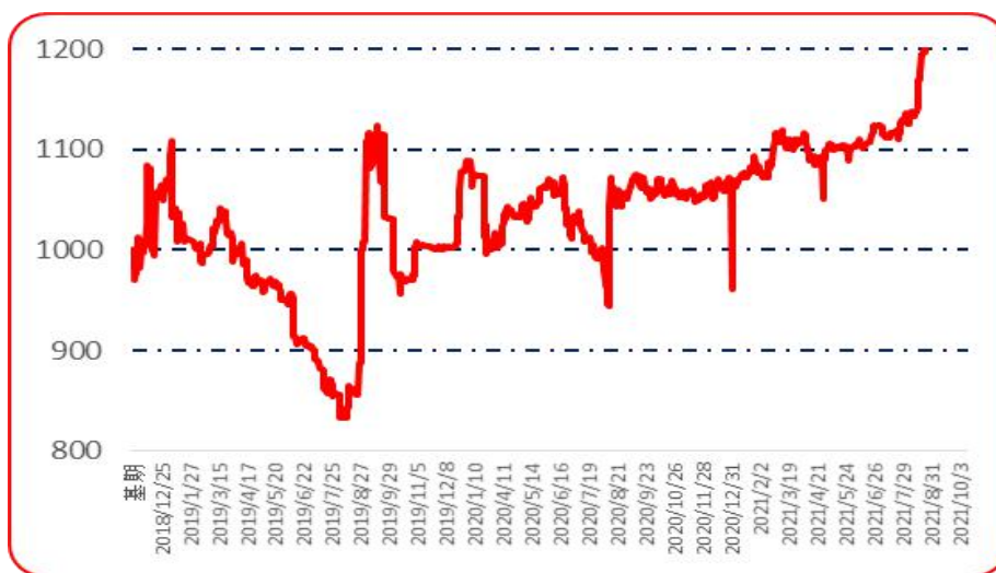
图 6 锥形椒批发价格指数运行图