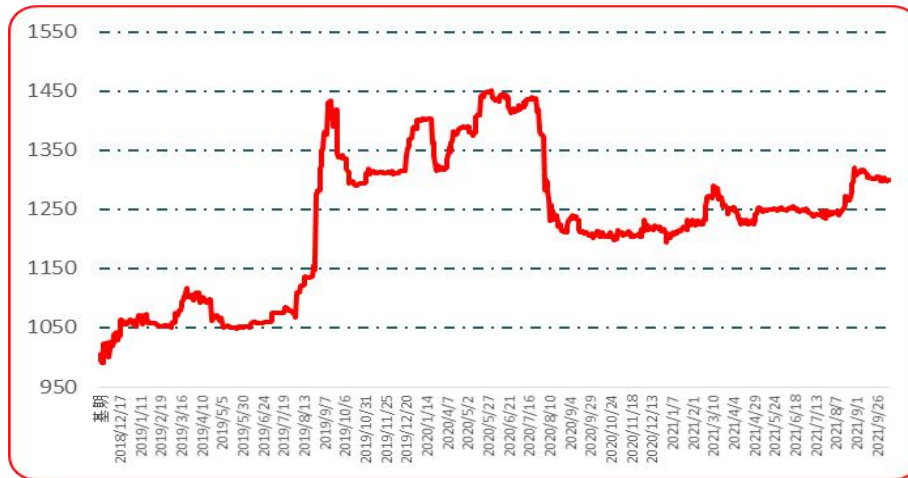
图 2 中国遵义朝天椒（干椒）批发价格综合指数运行图