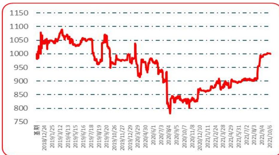
图 7 樱桃形椒批发价格指数运行图