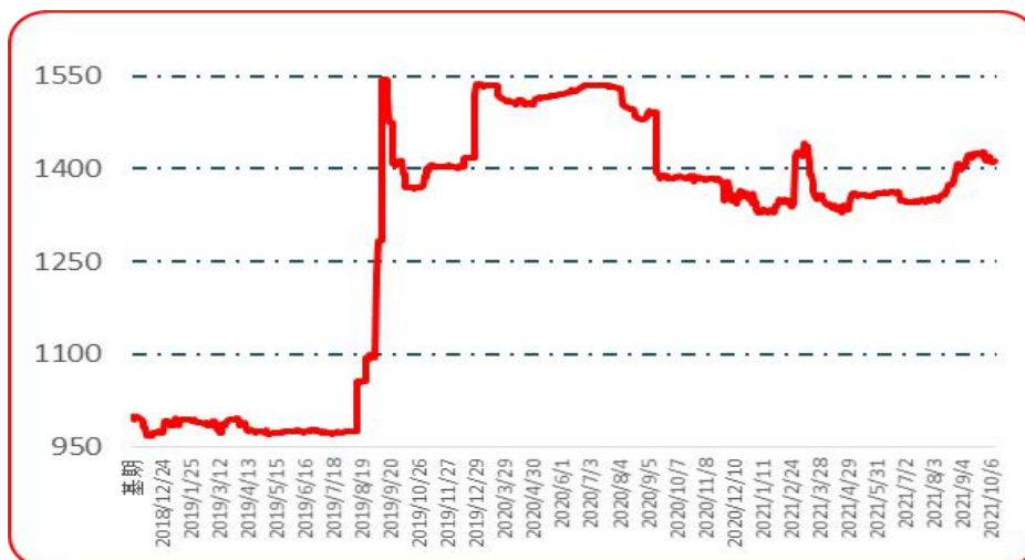
图 5 遵义朝天椒 1 号批发价格指数运行图