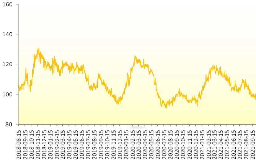
图 2：新华-香蕉销地批发价格指数